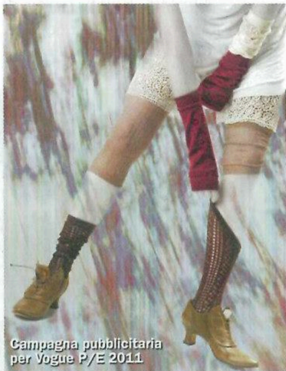
Campagna pubblicitaria per Vogue P/E 2011